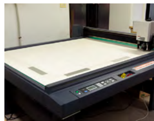
大型フラットベッドタイププロッター

仕上がり重視のハイクオリティ ロールラミネーター。 最大ラミネート幅 1,112mm。