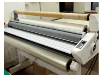
コールドラミネーター

最大加工サイズ900×1,170mm。 ハーフカットからダイカットを同時 に加工。厚物の輪郭カットにも対応。