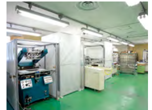
スクリーン印刷機 3台