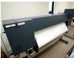
大判インクジェットプリンター

最大印刷は幅1,300mm。白インク対 応で透明フィルムなどへ鮮やかな 表現が出来ます。