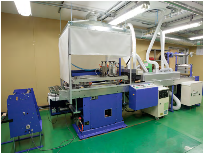
スクリーン印刷 ラベル印刷機

最大印刷幅 250mm。熱風乾燥装置・UV乾燥装置を搭載。 多品種・小ロットラベル印刷に最適です。