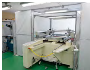
セミオートスクリーン印刷機