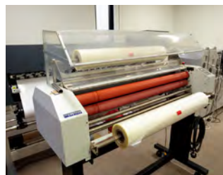
大型ホット・コールド兼用ラミネーター

最大印刷は幅1,300mm。白インク対 応で透明フィルムなどへ鮮やかな 表現が出来ます。