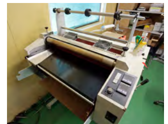
ホット・コールド兼用ラミネーター